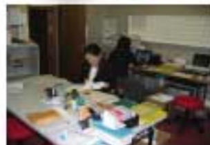
↑実際の 報告書業務の様子