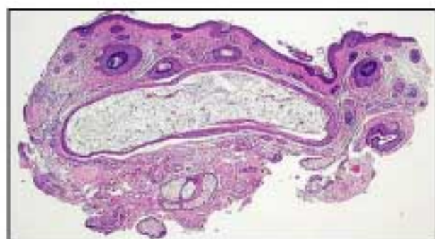
真皮内に上皮性の嚢腫がある。

66才、男性 採取部位：不明 臨床診断：Xanthoma? 病理組織診断：Steatocystoma