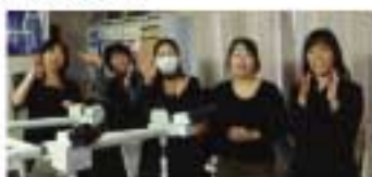
最後は全員で大合唱です!